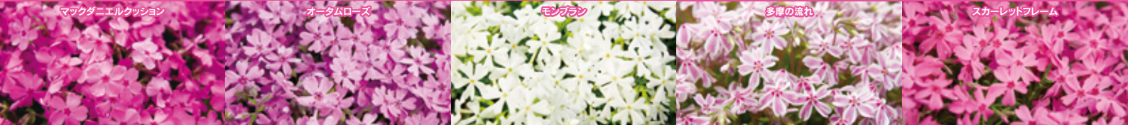
スカーレットフレーム